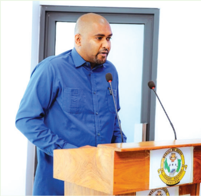
Msajili wa Hazina akitoa maelezo juu ya mikataba ya utendaji kazi.

Kupitia zoezi hili la kusaini mikataba ya kiutendaji kwa mashirika tisa ya Serikali, Ofisi ya Msajili wa Hazina Zanzibar imeimarisha msingi wa uwajibikaji, uwazi na ufanisi katika utendaji wa mashirika ya umma na kutekeleza matakwa ya Sheria. Hatua hii inalenga kuhakikisha mashirika ya umma yanafanya kazi kwa weledi, yanatoa huduma bora kwa jamii na yanachangia ipasavyo katika ukuaji wa uchumi wa Taifa. Matukio ya Ufungaji wa Mikataba kama invyoonekana hapo chini