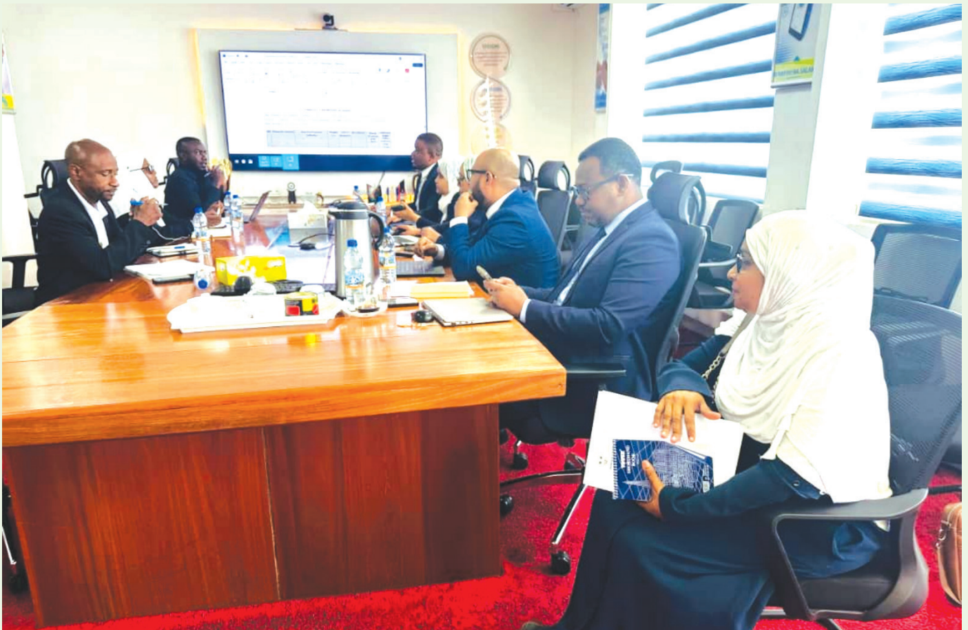
Watendaji wa Idara ya Mitaji ya Umma na Uwekezaji wafanya ufuatiliaji wa kufanya ufuatiliaji wa kuimarisha Mikataba ya Kiutendaji katika Benki ya Watu wa Zanzibar PBZ Mipirani.

Jumla ya Mashirika ambayo yaliingia mikataba wa Utendaji kazi kwa mwaka wa fedha 2024/2025 yalikuwa kumi na Moja (11) likiwemo ZHSF, ZSSF, ZSTC, ZAA, ZIC, ZBC, ZPC, CGN, ZPDC, ZICTIA, na SHIPCO. Aidha, Mafunzo ya Vitendo yaliweza kufanyika kwa Shirika la ZHSF, ZSSF, ZBC, ZPC, ZIC, ZSTC, ZAA pamoja na SHIPCO kwa kuingiza taarifa zao katika nyenzo.